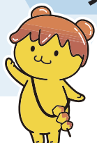
秩父市イメージキャラクター ポテくまん