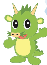
さいたま市 PR キャラクター つなが竜あく